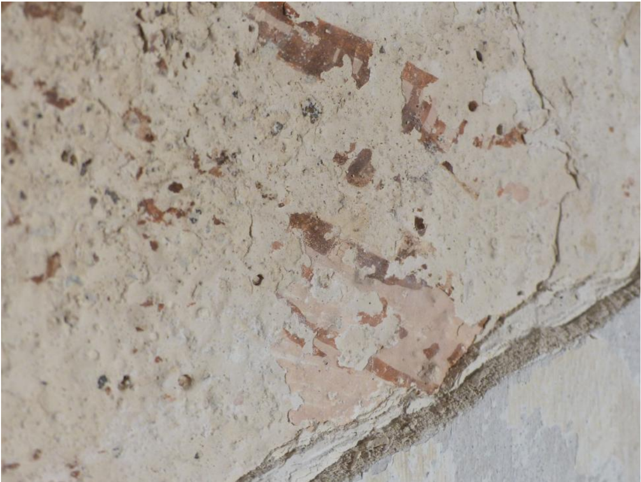
Vingen (?) – rosa bund, gule og brune streger. Hvide overkalkninger. Pudslag.

På den oprindelige kalkpuds er der kalket et lag varm-hvidt, hvorpå kalkmaleriet er malet. Oven på dette er der et til to lag hvidere kalkning, og atter flere lag kalkning, hvoraf nogle er ret tykke, nærmest som en svumning.