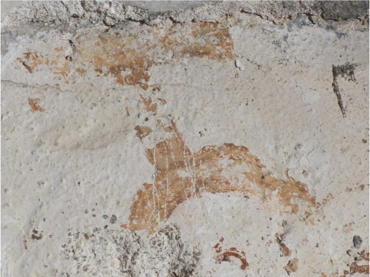
Hoved (?) – rødbrune streger, gult hår med mørkere streger.

De tykkere lag kalkninger/svumnings har formentlig skullet udjævne og lukke revner i murværket – det er også her at pudsen især er løsnet. Revner giver hist og her træk fra murlivets trappeopgang – muren er relativ tynd mellem trapperum og tårnrum.