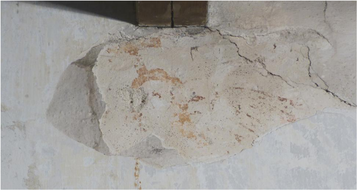
Kalkmaleriet – en engel?

På den oprindelige kalkpuds er der kalket et lag varm-hvidt, hvorpå kalkmaleriet er malet. Oven på dette er der et til to lag hvidere kalkning, og atter flere lag kalkning, hvoraf nogle er ret tykke, nærmest som en svumning.