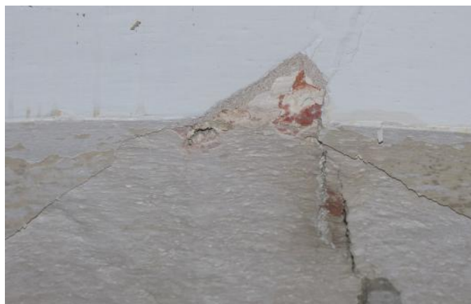
Farven går op af væggen omkring kanten.