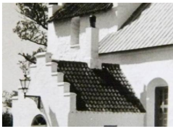
1950-erne? Overdækningen er fjernet og skorstenen forhøjet, og med aftrækshætte. Hvidkalket. Bemærk lampen over døren.