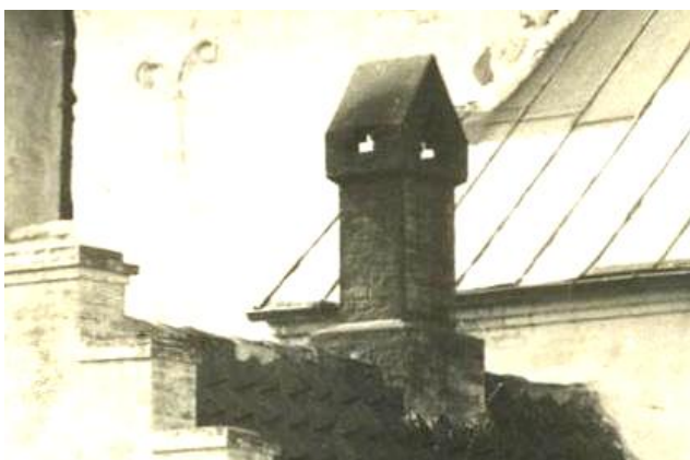
Udsnit af ældre fra 1910'erne. Skorstenen er tydeligt sodsværtet fra et kulfyr.