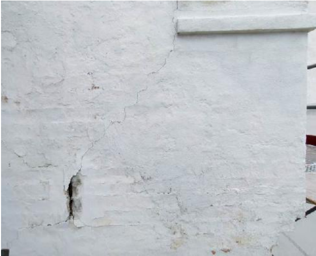
Fra murankrene "stråler" revner ud i muren.

En enkelt rustklump midt under lampen stammer fra en bolt til den tidligere lampe på gavlen.