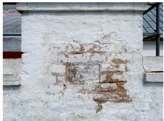
Afrensningsprøve omkring årstallet 1864

NHL foretog – sammen med MHN en afrensning af murværket – se senere beskrivelse.