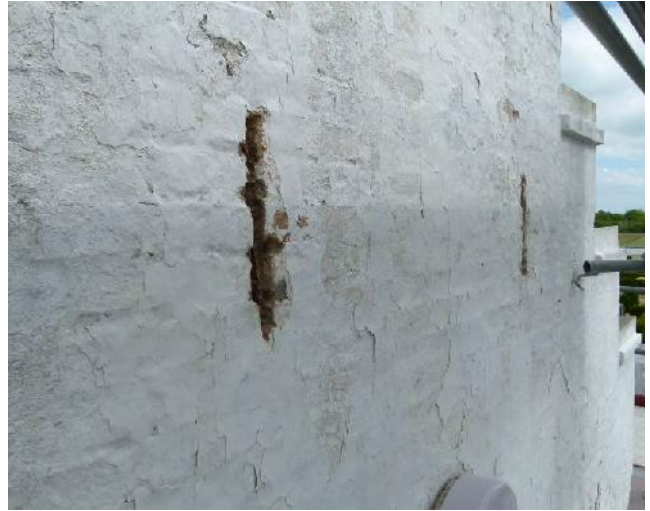
To frilagte murankre.