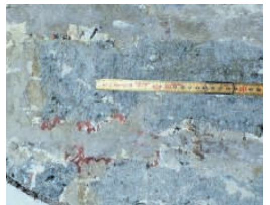
Små rester af motivmaling. Sidder meget tæt på den originale 1200-tals vægflade.

"O Menniske i hvo du est Betenk at Krig Dyr tid og Pest Er Syndens Løn og Ende, Frygt Gud derfor og lyd hans bud Og lad Dig snart omvende"