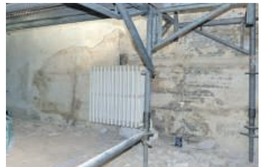
Sydvæg i koret. Her kom tilmuringen af den tidligere præsteindgang frem – og rester af kalkmalerier.