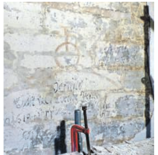
Midt på væggen en pesttavle med en gul bue med et patriarkalkors i toppen af en cirkel.