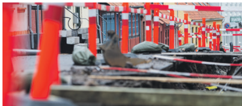
40-45 procent af Arnager har givet et foreløbigt tilsagn til fjernvarme.