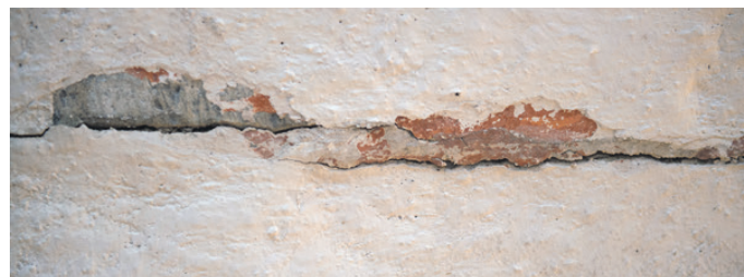
Udsnit af kalkmaleriet på buen mellem tårnrummet og kirkeskibet. Foto: Jens-Erik Larsen