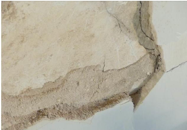
Tre til fire lag.