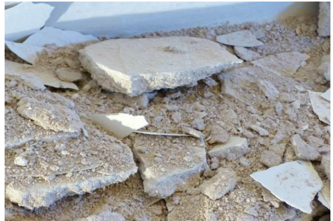
Meget løst og smuldrende.

Pudsen har en anden karakter end oppe bag orglet. Denne kalkpudser løs og smuldrende. Den har små hvide kalkklumper i sig, og er blandet af ret ensartet sand. Den er sat på ad flere omgange til ca. 3 cm tykkelse – yderst er et mere sammenhængende fast pudslag. Pudsen er sat på en ældre kalkning med mange fastsiddende lag kalk – nok tårnrummet ”oprindelige” ujævne overflade. Der er revner – hvorfra det trækker igennem /er ud for trappen i tårnet. Her skal der ny puds på.