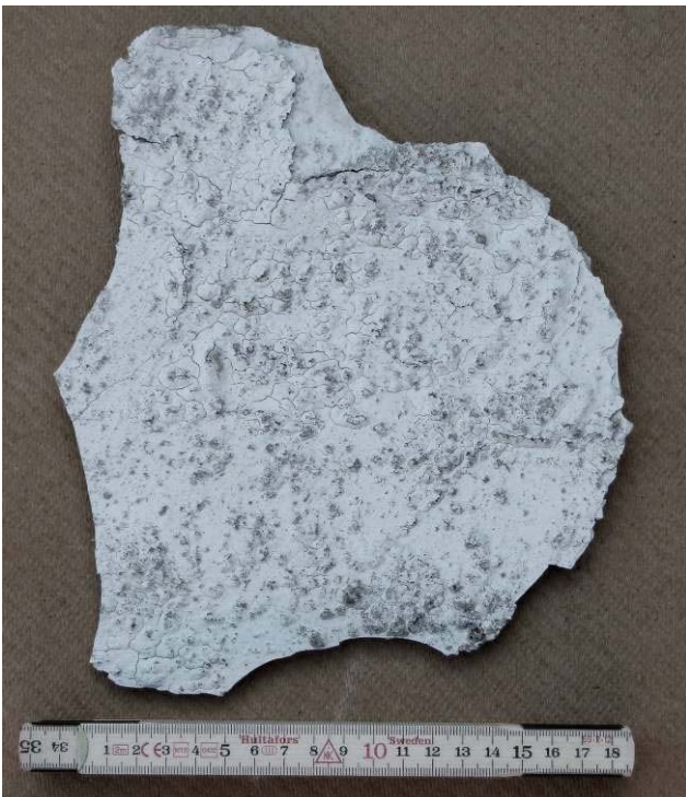
Flage af maling – nubret og krakkerleret.