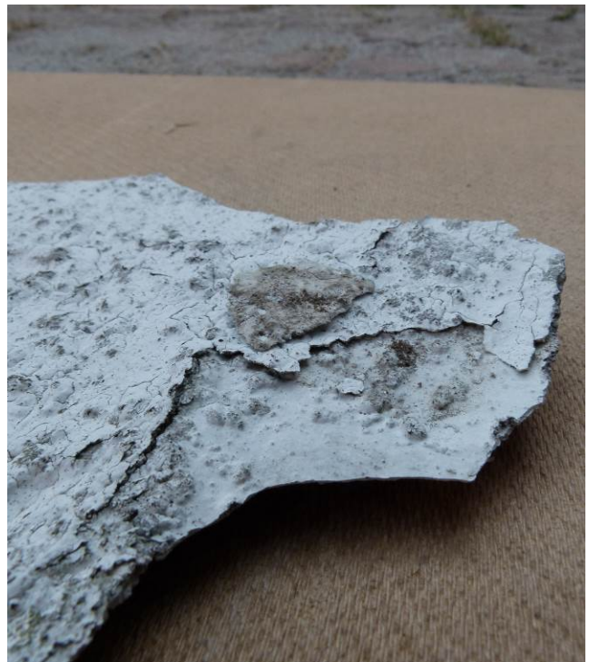
Der er mindst to lag, som "slipper".

De nedblæste flager er elastiske og brænder med en sodende flamme, der klart viser at der er tale om maling – dog uvist hvilken type.