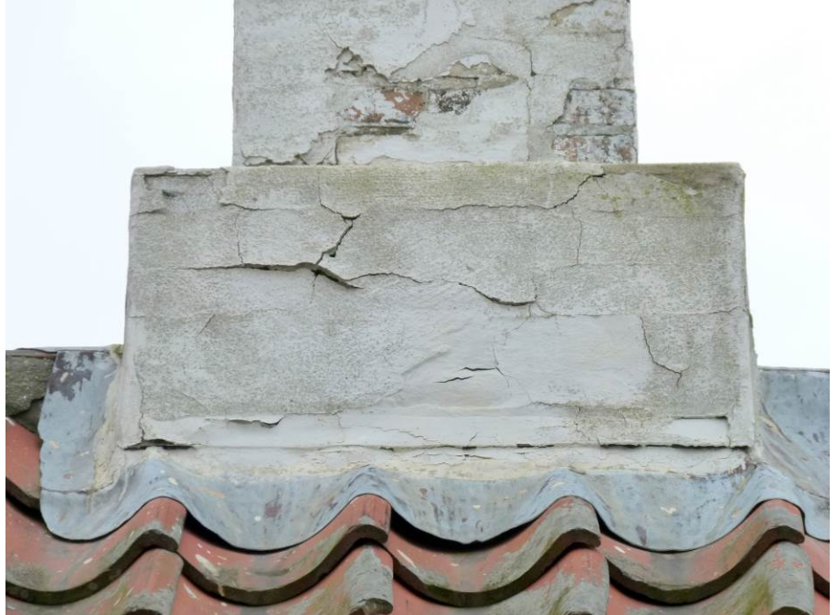
Skorsten på våbenhuset – er tydeligvis malet.